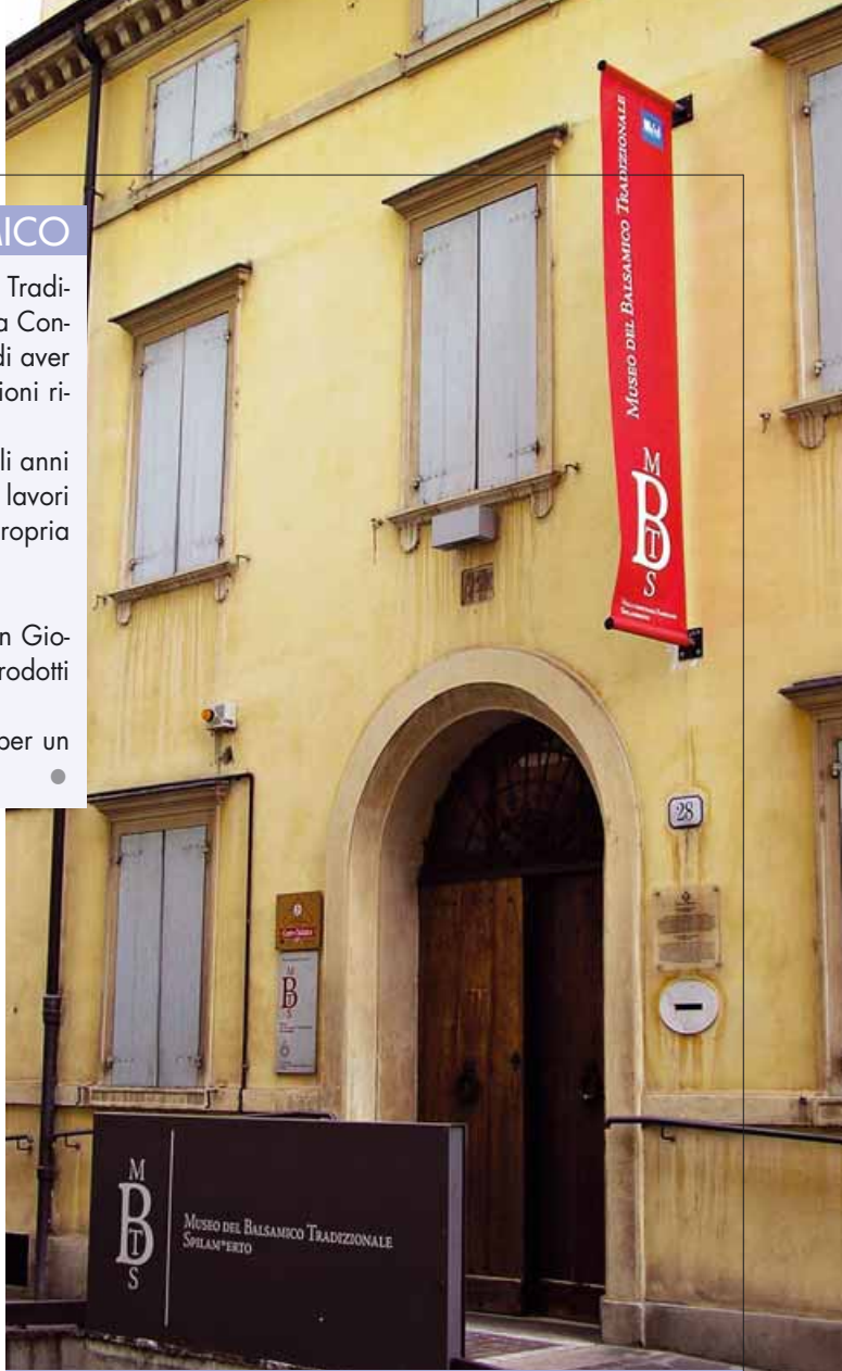
La sede della Consorceria a Spilamberto

Solo da pochi anni, in realtà, il Balsamico Tradizionale ha assunto una valenza eco-